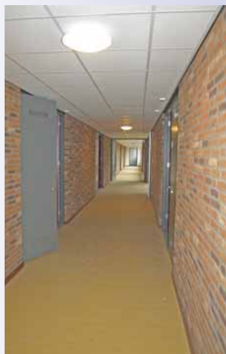
Gang ten behoeve van de appartementen.