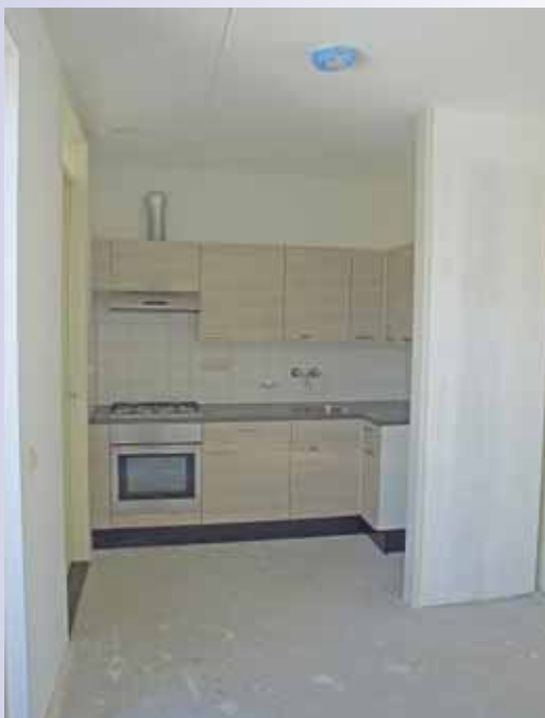
De open keuken met links de deur naar de grote berging en rechts de berging onder de trap.

één keer een zaterdag gewerkt. Zelfs de modder had geen invloed op de werktijd, al kwam er wel een keertje een kraan aan te pas om een wegzakkende steiger weer waterpas te zetten. Met behulp van planken werd het maaiveld begaanbaar gemaakt. Al met al resulteerde dit erin dat de woningen zes weken sneller gebouwd zijn dan de traditionele aanpak. De oplevering vond plaats op 5 februari en twee dagen later kregen de huurders al de sleutel van deze prachtige woningen.