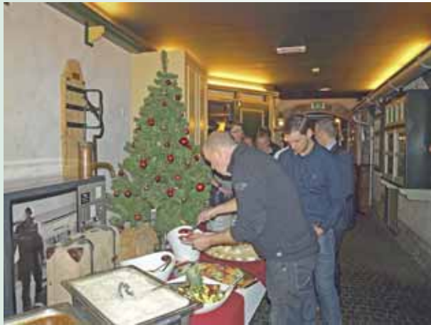
De ontvangst in kerstsfeer met een heerlijk warm/koud buffet.