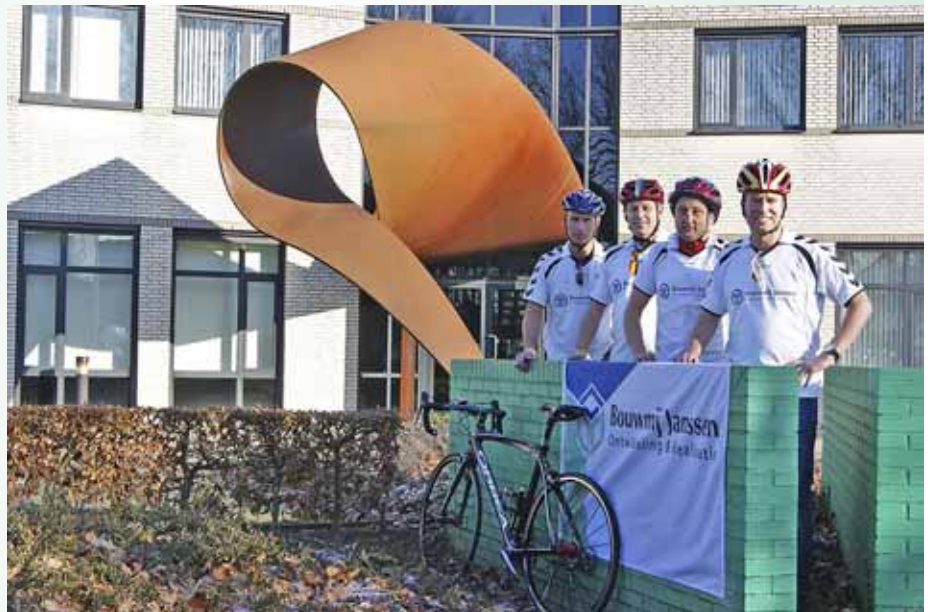
Teamfoto "Aan het Elastiek".

zakje doen. Ondertussen gaan ze trainen, want het is natuurlijk niet niks. De verzorging ter plekke bij de start, onderweg en op de top, neemt de organisatie voor haar rekening, maar de inspanning moet je zelf leveren. Belangrijk is dat je klimt in je eigen ritme. Je niet gek laten maken door de anderen. Er zijn ongeveer 375 deelnemers. Bijna allemaal uit Nederland, waaronder ook veel vrouwen. Mannen: succes!