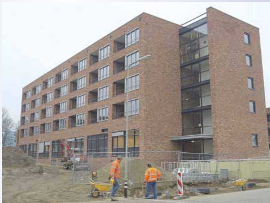
Voorraanzicht van het complex.

De bewoners kunnen ook overdekt buiten zitten in een loggia van 2.70 bij 2.30 meter. Verder is er nog de entree met toegang tot de woonkamer, badkamer en berging. Hierin hangt de centrale verwarmingsketel en de installatie voor de mechanische afzuiging. Er is ook nog plaats