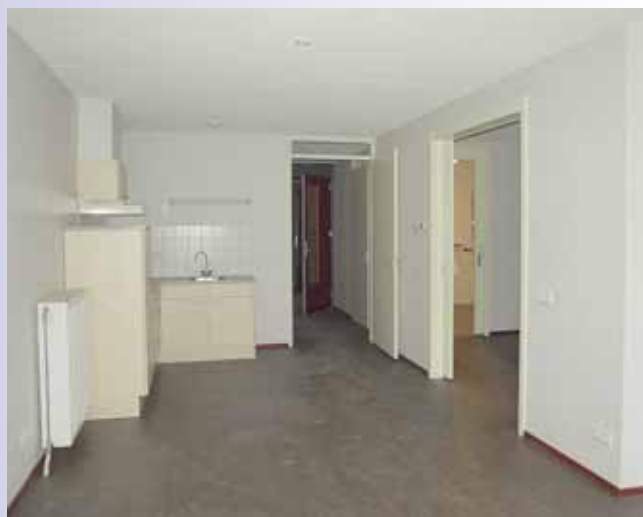
Inrichting van een appartement.

ject ParcVelt voltooid. Mooi uitgevoerde projecten zijn dan in de wijk Veltum verschenen en mooi ook dat de vlag van Bouwmij Janssen hier geruime tijd heeft mogen wapperen.