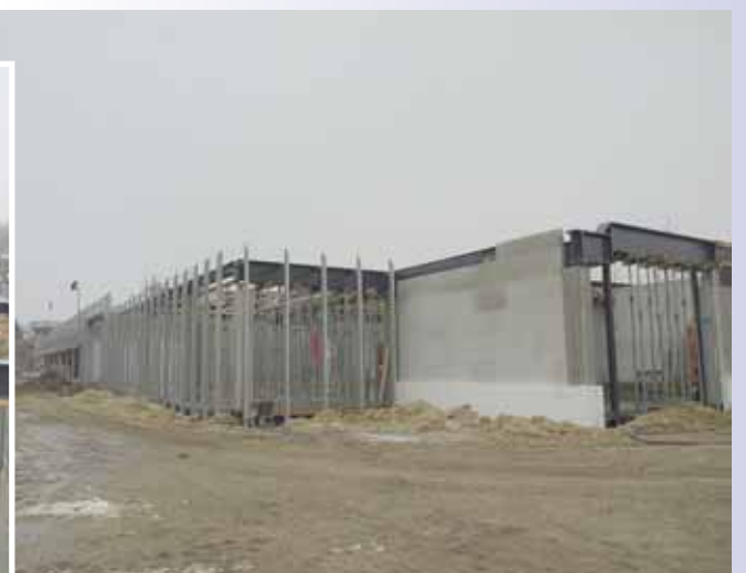
Staalconstructie begane grond.