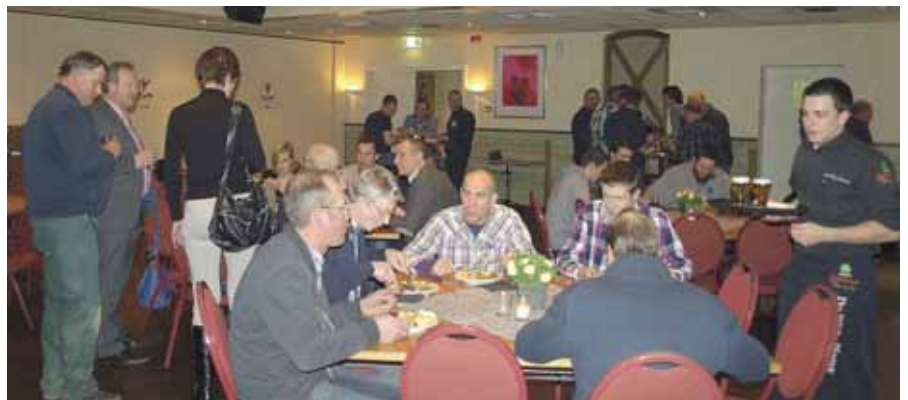
De medewerkers van Bouwmij Janssen genieten gezellig van het koude en warme buffet.

Meer over de halfjaarlijkse bijeenkomsten op de pagina's 2 en 3.