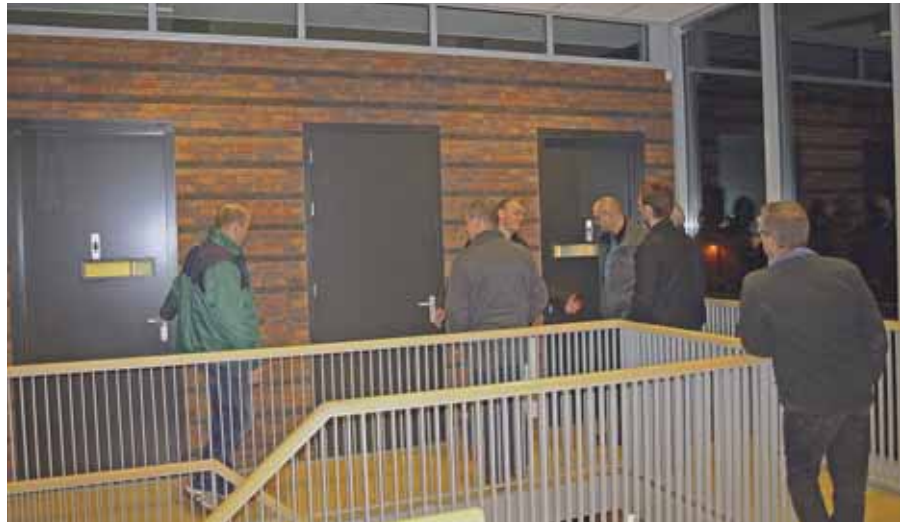
Rondleiding in het door Raedts Bouwbedrijf verbouwde Kindcentrum.

Voor Bouwmij Janssen zal het nog zeker twee jaar moeilijk blijven, maar 2013 is goed van start gegaan met mooie projecten en een organisatie die klaar is voor de komende tijd. Raedts Bouwbedrijf sloot 2012 af met een tevredenstellend resultaat en kijkt met vertrouwen uit naar de toekomst.