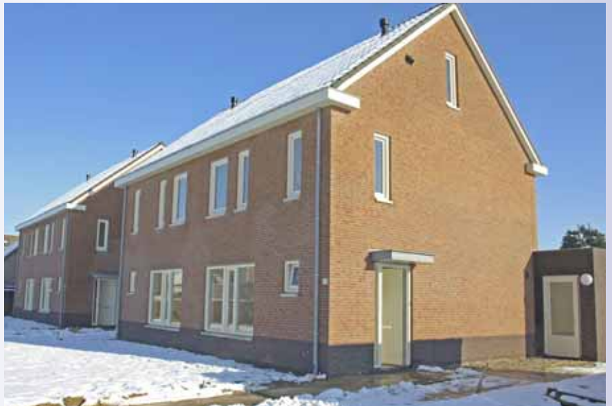
Prachtige, grote huurwoningen in Maashees.

De begane grond heeft een ruime woonkamer met open keuken die enigszins weggewerkt is doordat deze achter de trap ligt. Vanuit de keuken kan men naar de berging die een achterdeur heeft. Hier hangt de ketel voor de verwarming. Onder de trap bevindt zich ook nog een berging. Een dubbele deur geeft toegang tot de tuin. In de hal een apart toilet. Op de verdieping vinden we drie slaapkamers, waarvan eenje kleiner is. De badkamer is vrij groot en heeft een inloopdouche plus toilet. Nog een verdieping hoger de ruime zolder met in het dakvlak een kantelraam. Hier bevindt zich de installatie voor de luchtbehandeling. Zowel onder als ook op de verdieping ligt vloerverwarming. Alle ruimtes zijn van een thermostaat voorzien en zijn afzonderlijk regelbaar. In de woningen, die al verhuurd zijn, konden de huurders hun wensen kenbaar maken uit een bepaald assortiment van de Bruynzeel keukens. Ook met de keuze van het tegelwerk werd rekening gehouden.