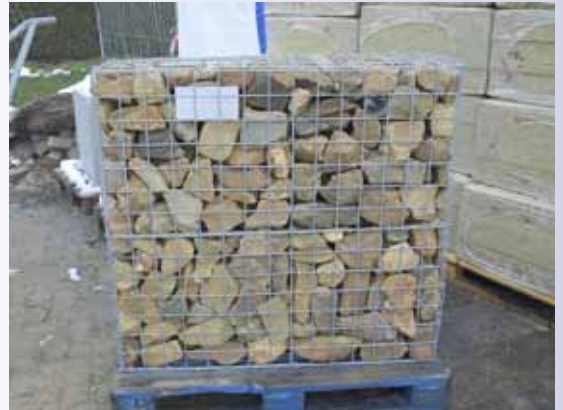
Voorbeeld van steenkorven ten behoeve van de gevelafwerking op de begane grond.

Het bouwwerk staat niet op palen maar de fundering is verstevigd met poeren. Sommige zijn wel vier bij vier meter en zestig centimeter hoog. De kalkzandsteenwanden van de woontorens rusten op een reeks zware stalen balken, die in de verdiepingvloer gestort zijn. Deze zijn vijf centimeter getoogd en moeten door belasting terugzakken. Niet ineens maar geleidelijk. Dit gebeurt al voordat op de vloer gewerkt wordt. De onderslagen worden iets losgezet waarna de vloer belast wordt. Is de toog enkele centimeters minder geworden dan worden de stutten weer aangedraaid en kan met kimmen begonnen worden. Dit levert dan wat problemen op, want de balk is nog steeds getoogd, dat moet er bij een volgende bouwlaag uitgehaald worden. Een strookje van de kim zagen biedt de oplossing. Het laten schrikken met vloeren en wanden die al in en op de balken rusten geschiedt onder begeleiding van de constructeur.