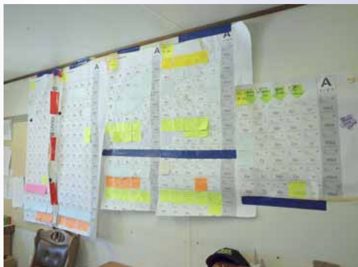
Tegen de wand het Lean-verhaal, de planning.