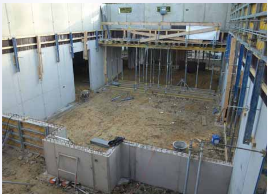
Podium, zaal en achterin de bar.

De architect heeft zich voor het ontwerp van het nieuwe jongeren centrum op sportpark De Wieën laten leiden door de atoombunker die op het voormalige militair vliegveld Laarbruch, nu Airport Weeze, te vinden is. Een betonnen skelet, met wanden van twintig centimeter, als binnenspouwblad. De gevels worden opgetrokken met bia betonblokken. Deze worden voorzien van een raaplaag en daarna van stucwerk voorzien in een roestkleur. Het hart van het jeugdhonk bestaat uit een zaal met podium. Dit is hoogbouw met daarom heen aan drie zijden laagbouw. Eén zijde herbergt de toiletgroep met twee douches en een kleedruime voor de artiesten. Hierin bevindt zich aan de kopzijde ook de hoofdingang.