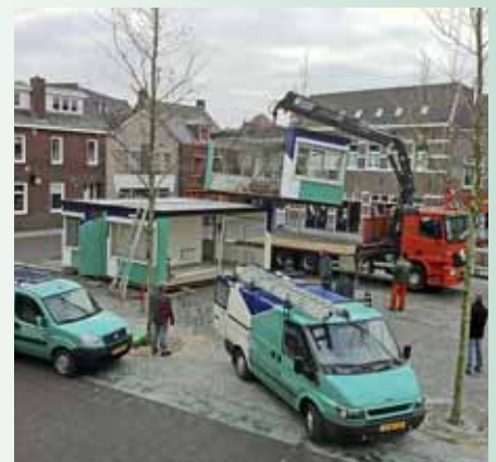
't Roojse Huus in 2012.

De uitzending van 't Roojse Huus zal plaatsvinden van 18 tot 22 december op het Henseniusplein in Venray.