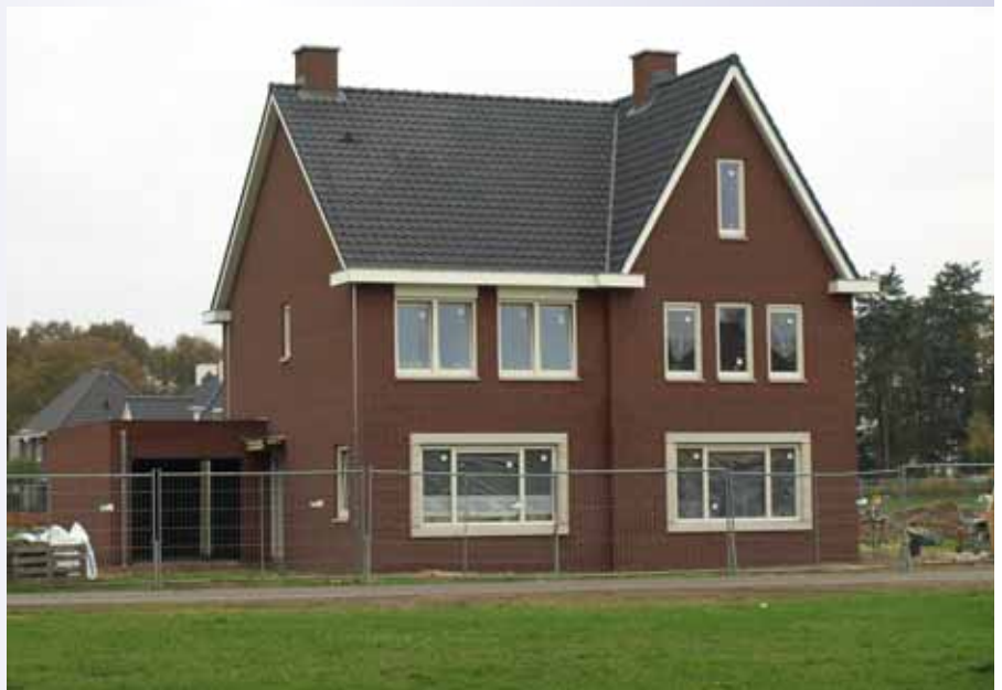
De ruime zolderruimte van de rechtse woning..

schoorsteen, terwijl dakoverstekken en bakgoten vervaardigd zijn van rockpanel.