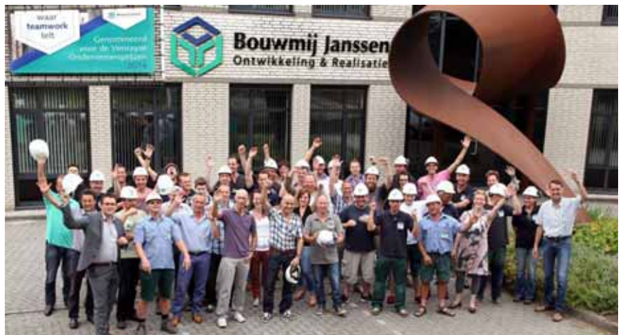
Team Bouwmij Janssen.

Toen ik het stukje uit De Hoeksteen van vorig jaar zat terug te lezen, kon ik niet anders dan constateren dat de omstandigheden voor ons als Bouwmij Janssen er nou niet direct veel beter op zijn geworden. Nog steeds zijn er bouwbedrijven die failliet gaan, nog steeds is er minder werk dan voorheen en nog steeds zijn banken vooral met hun eigen balansen druk doende maar... er zijn inmiddels toch wel enige lichtpuntjes op te merken.