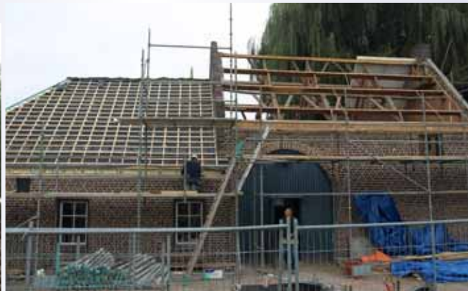
De restauratie van de Watermolen Oostrum in volle gang.