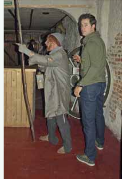
Waren er ook ongenode gasten?

met het van tafel naar tafel demonstreren van het een op een fopspelletje. Het buffet speelde zich weer in het andere zaaltje af. Het was goed maar het moet gezegd worden dat degenen die te lang gewacht hadden tot de ontdekking kwamen dat zelfs de hond in de pot niet te vinden was. Zo vorderde de avond gestaag en steeg de spanning, want de directie maakte in haar welkomstwoord gewag van een spectaculaire afsluiting, waar toch vooral iedereen voor moest blijven tot sluitingstijd. De dj had inmiddels de meute zover gekregen dat spontaan een polonaise in gang werd