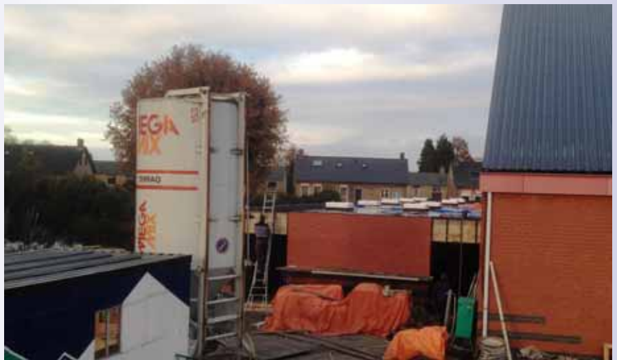
Het buitenwerk van de uitbreiding is zo goed als klaar, binnen is men nog volop bezig.

mede-aannemers installatiebedrijf Van Tilburg en Elektro Van Berlo aan de realisering van dit project. Ondanks de krappe planning, waarbij vooral het drogen en uitharden van beton (in verband met het weghalen van stutten) en het drogen van de vloer een grote rol spelen, hoopt Raedts Bouwbedrijf in week twee van het nieuwe jaar op te leveren.