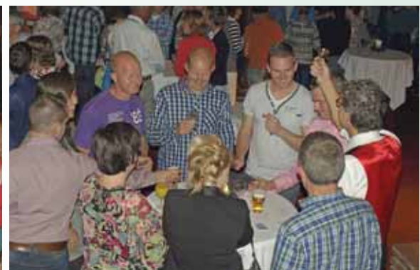
Aan tafel werden ook nog wat goochelkunsten gedemonstreerd.